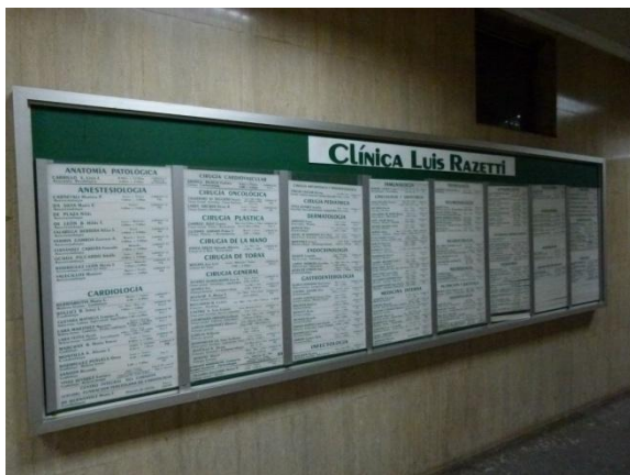
Fotos actuales de la Clínica Luis Razetti