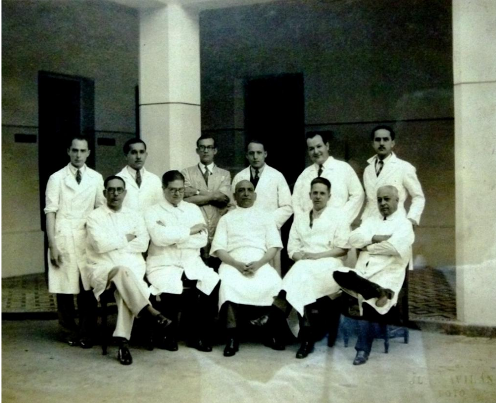
Fig 2. Foto de algunos de los Fundadores