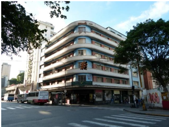
Fig 4. Antiguo edificio Colimodio

La extensión total de la clínica actualmente es de 7694 m 2 . Mantenemos 46 camas de Hospitalización, contamos con los servicios modernos de: Radiología General, TAC, Resonancia Magnética, Ecografía Tridimensional, Emergencia Permanente, Terapia Intensiva, Banco de Sangre, Laboratorio Clínico, Fisiatría y Rehabilitación y CICOR (Fundación Venezolana de Cardiología , Centro integral) , una unidad de Hemodiálisis y una Capilla. Contamos con un equipo de 200 médicos y 20 odontólogos en sus diferentes especialidades.