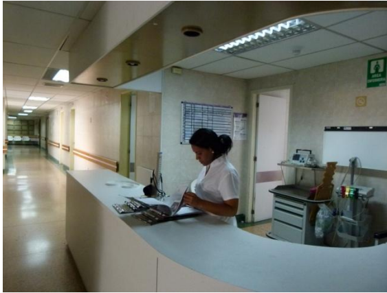
Puesto de Enfermería