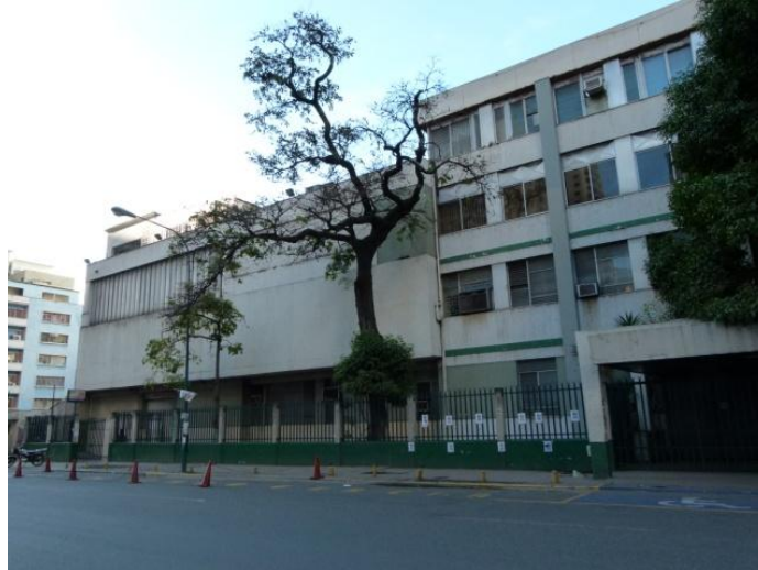
Fig 3. Edificio Principal

La Clínica Razetti tiene 80 años de funcionamiento ininterrumpido, en la misma ubicación: Avenida Este 2, entre Sur 19 y Sur 21, Parroquia La Candelaria. Ocupa la siguiente superficie: Edificio Central (Fig 3. 4 pisos), Anexo 1(Odontología) y estacionamiento, 6.454 m 2 de terreno. Anexo dos: Antiguo Edificio Colimodio (Fig 4: 6 pisos, consultorios, hemodiálisis y locales comerciales en la planta baja. Con más o menos 840 m 2 de terreno. Anexo tres: al sur del Edificio Colimodio, actualmente en disputa ante tribunales, por invasión popular. Consta de 5 pisos con 400 m 2 de terreno y que se llamó Instituto Clínico.