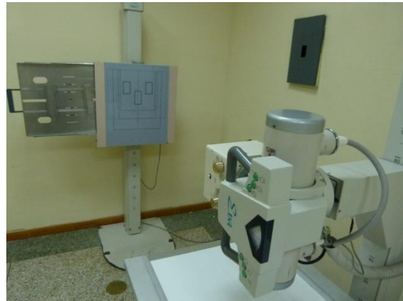
Unidad de Radiología