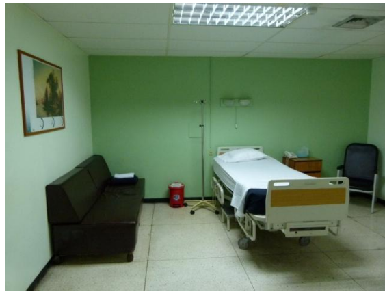
Una de las 46 habitaciones